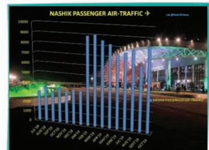
AIR Traffic Success