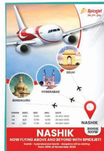
Spice jet Connectivity