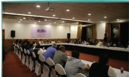
24 Association Presidents- IPPs