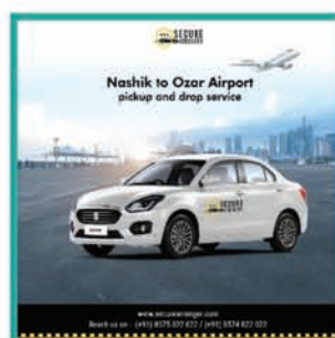
AIR Port TAX Services