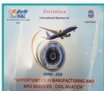
HAL- MRO Boeing Overhaul