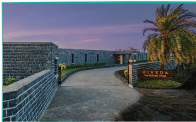
VIVEDA-Global Wellness Village